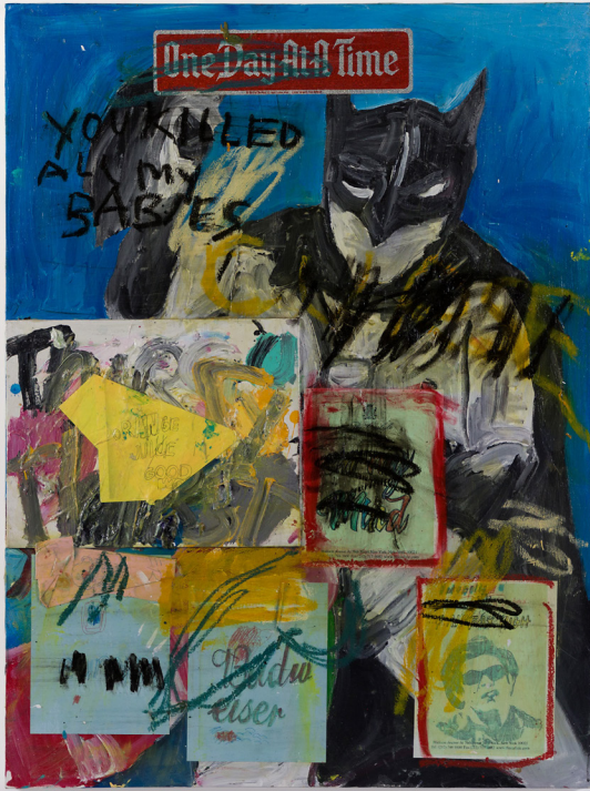
Muse Task One Day At A Time (Batman), 2022 Collage, mixed media on canvas