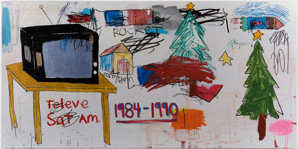
Muse Task 1984-1990 Acrylic on canvas