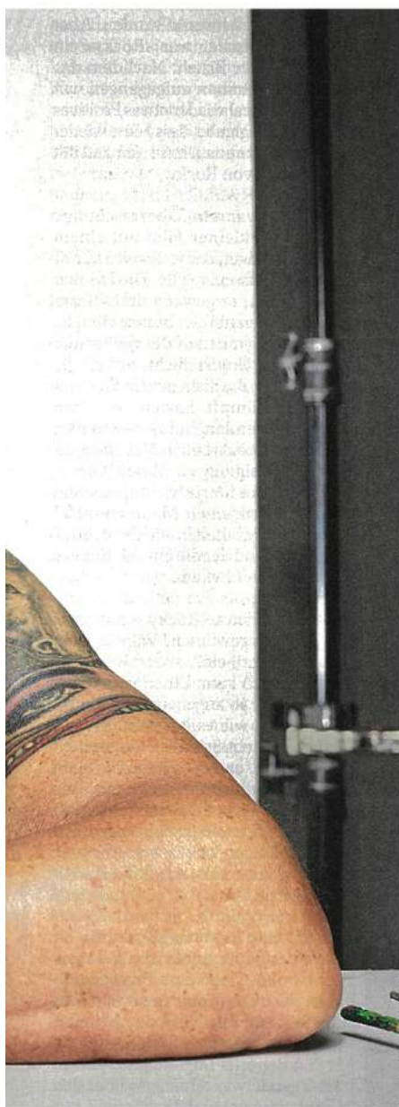
Martin Schreiber / DER SPIEGEL

E r steht in seinem neuen Haus in Palm Beach, das noch immer eine Baustelle ist. Er trägt blaue Überziehschuhe mit Gummizug, um das Parkett im Wohnzimmer nicht zu zerkratzen, und schaut auf die leere Wand im Flur neben der Küche. Seine Frau steht neben ihm. Sie hat vorgeschlagen, dort ein Gemälde von Joyce Pensato aufzuhängen, eine Version der Comicfigur Batman, Lack- und Metallicfarben auf Leinwand, 2,08 mal 1,88 Meter groß. Das Bild ist eines von insgesamt 50 aus seiner Privatsammlung, die hier in den nächsten Tagen ihren Platz finden sollen.