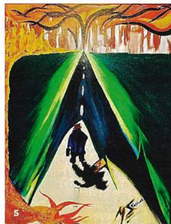
Stallone-Bilder: 1 | »Tony is a Phony«, 2017 2 | »Rambo Mind«, 2012 3 | »Myth Shit«, 1988 4 | »Danse Macabre #1«, 2018 5 | »Inferno«, 1966 6 | »Danse Macabre #5«, 2015